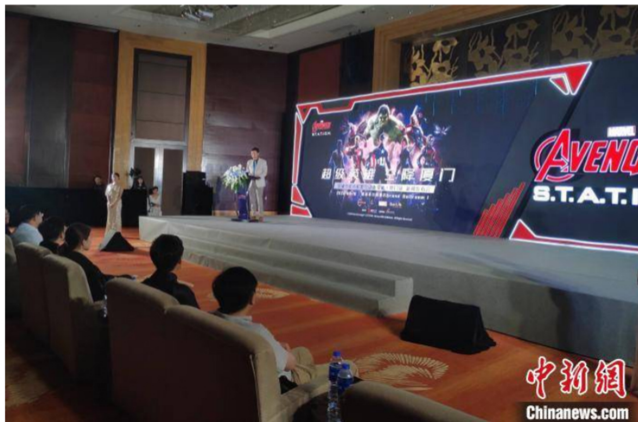
活动现场。

主办方介绍说，此次复联互动体验站巡回展厦门站，由美国漫威、迪斯尼、新加坡城贸控股、VHEI以及拾忆文化联合主办，厦门会展集团旗下的壹号公关唯一协办。众多实力的行业巨头跨国联盟，致力为广大影迷们带来一场震撼的视听盛宴。