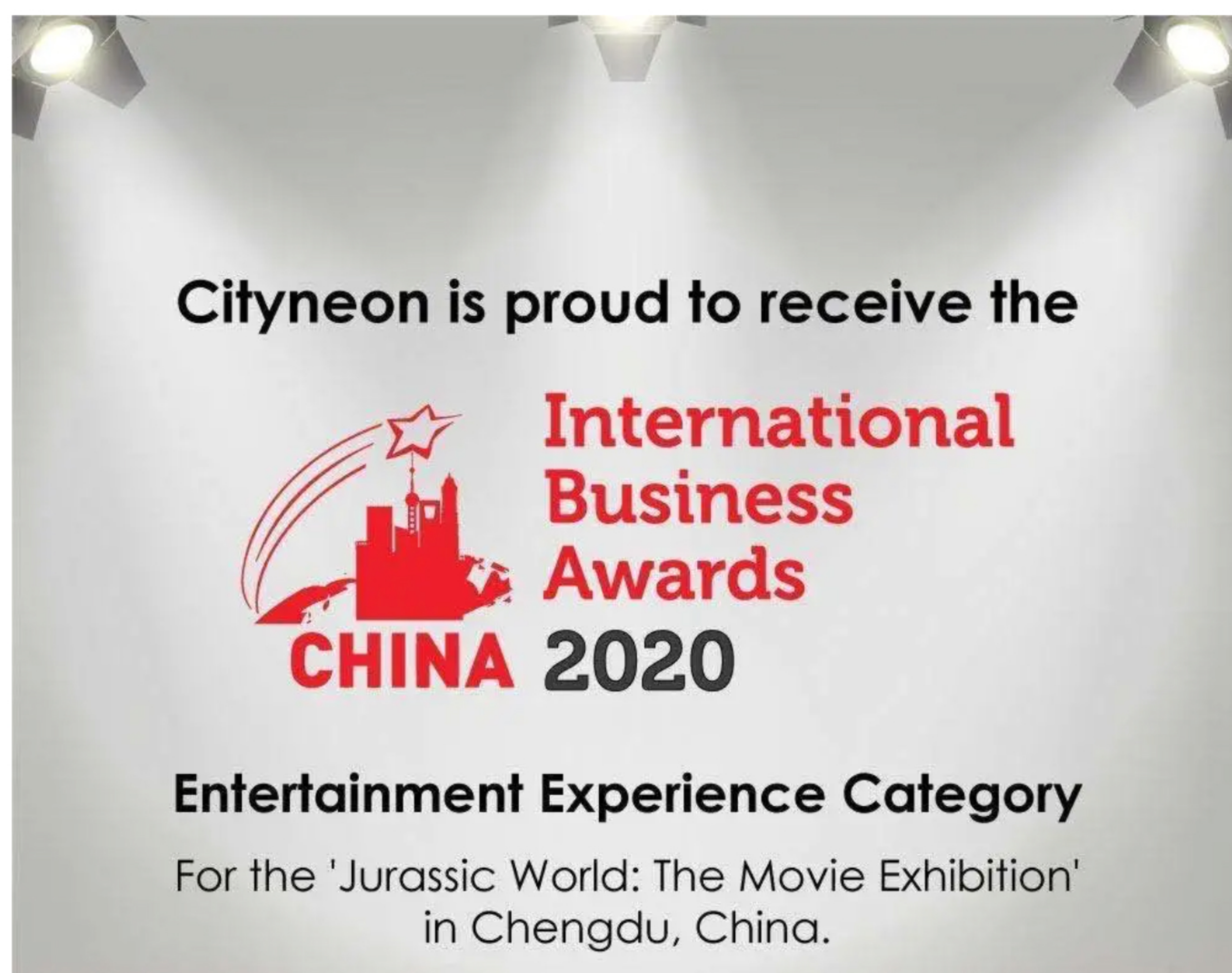
城贸控股获得“中国国际商业奖”体验娱乐类奖项

“侏罗纪世界电影特展”是城贸控股旗下核心展览之一，它将电影制作艺术和科学完美结合，运用《侏罗纪世界》系列电影的创造性叙事，将其赋予新的创意并通过沉浸式互动体验的方式呈现，近五年来已入驻芝加哥、马德里、巴黎和首尔等全球35个城市。