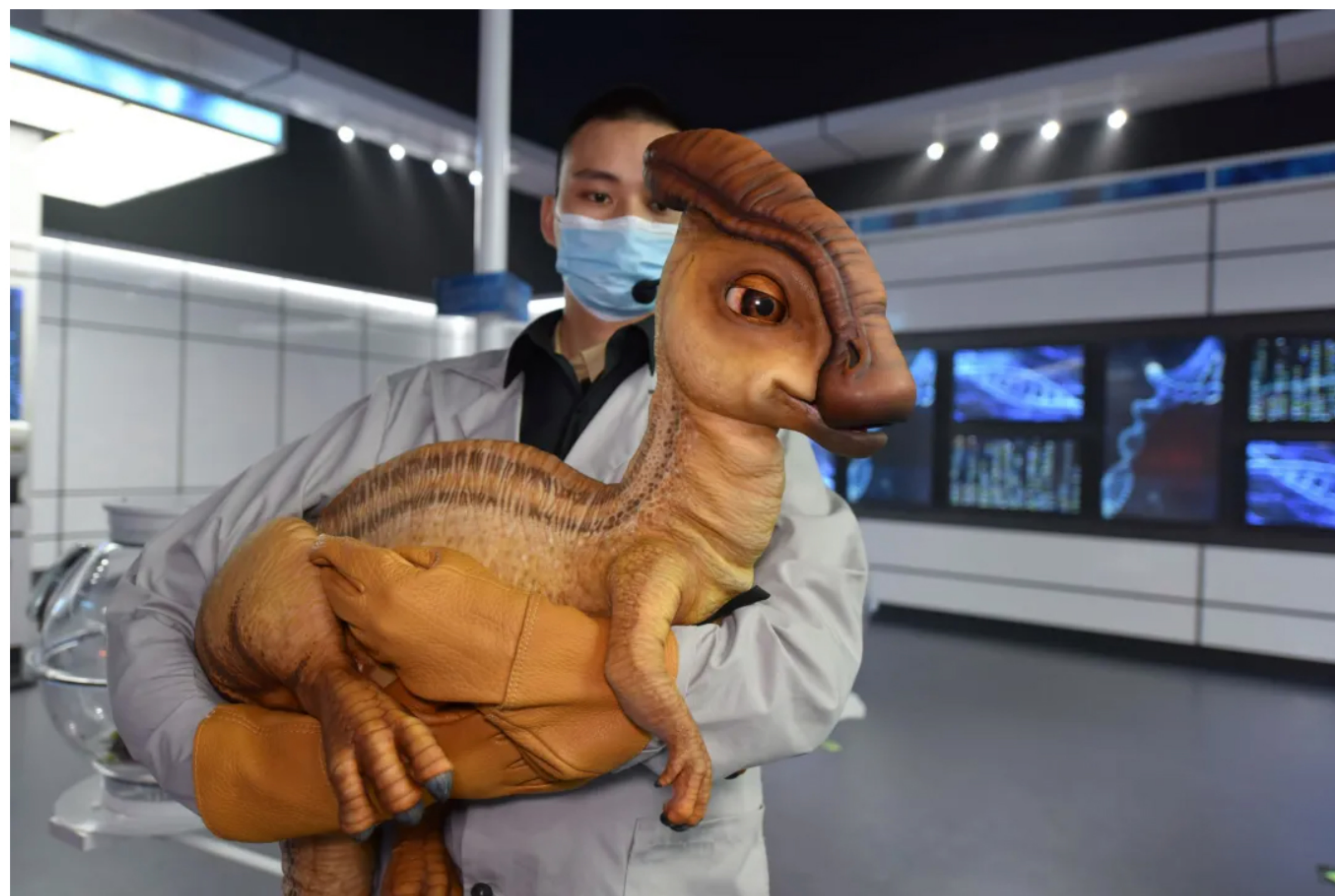
今年7月“侏罗纪世界电影特展”首次进入中国

今年7月“侏罗纪世界电影特展”首次进入中国。特展位于成都大熊猫繁育研究基地的熊猫广场，占地约2700平米，引入了目前国际上最先进的电子机械、动画电子互动技术，严格按照恐龙化石记录和科学研究记录，高度还原恐龙特性，为游客们奉上了一场充满悬念和创意体验的难忘旅程。此外，城贸控股旗下的“漫威复仇者联盟互动体验站世界巡回展”也于8月入驻厦门，是近年来福建地区引进的最大国际文娱IP项目，不仅有力地推动了疫后城市经济复苏，还充分体现了城贸控股在进军更广泛市场方面取得的成就。